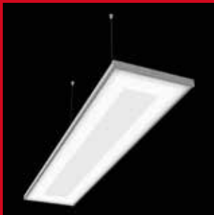
AVIC PRO 276