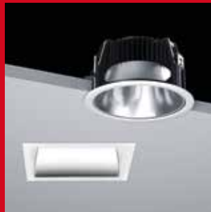
TENTEC ZONO 212