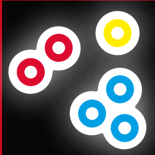
CLOUD 20 CLOUD COLOR 23

MEHR DETAILS KATALOGSEITE | FURTHER INFORMATION CATALOGUE PAGE